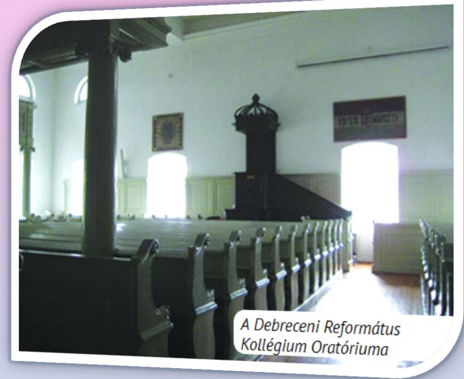
A Debreceni Református Kollégium Oratóriuma